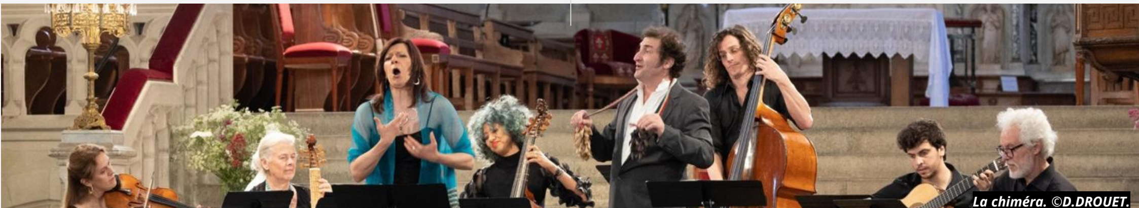
La chiméra. ©D.DROUET.