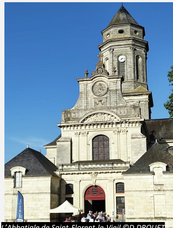
L'Abbatiale de Saint-Florent-le-Vieil

Cette petite cité de caractère se distingue comme l'un des hauts lieux touristiques de l'Anjou, valorisant son patrimoine et sa richesse culturelle à travers des lieux symboliques comme la maison Julien Gracq ou l'Abbatiale surplombant la Loire (photo à droite).