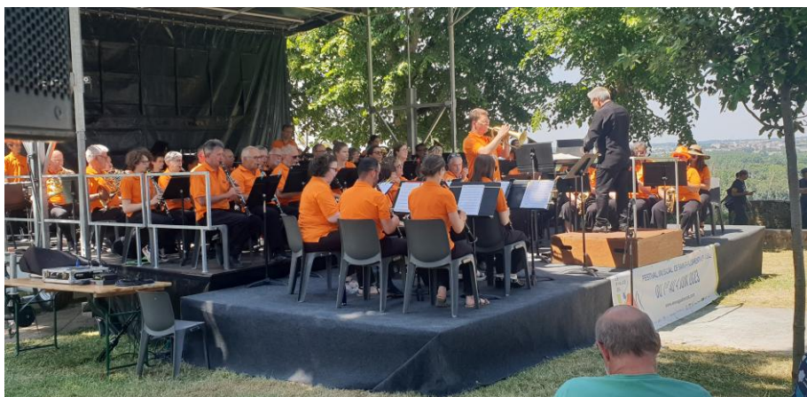
Le "village du festival" et le kiosque musical