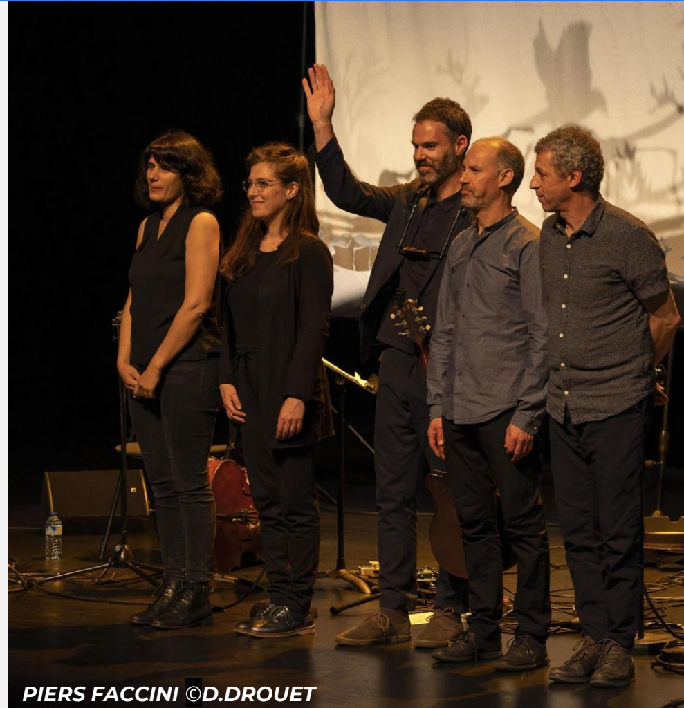
PIERS FACCINI