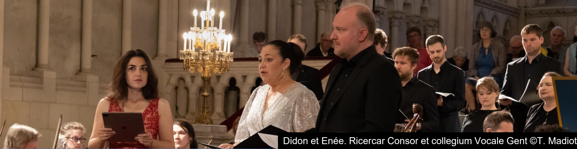
Didon et Enée. Ricercar Consor et collegium Vocale Gent