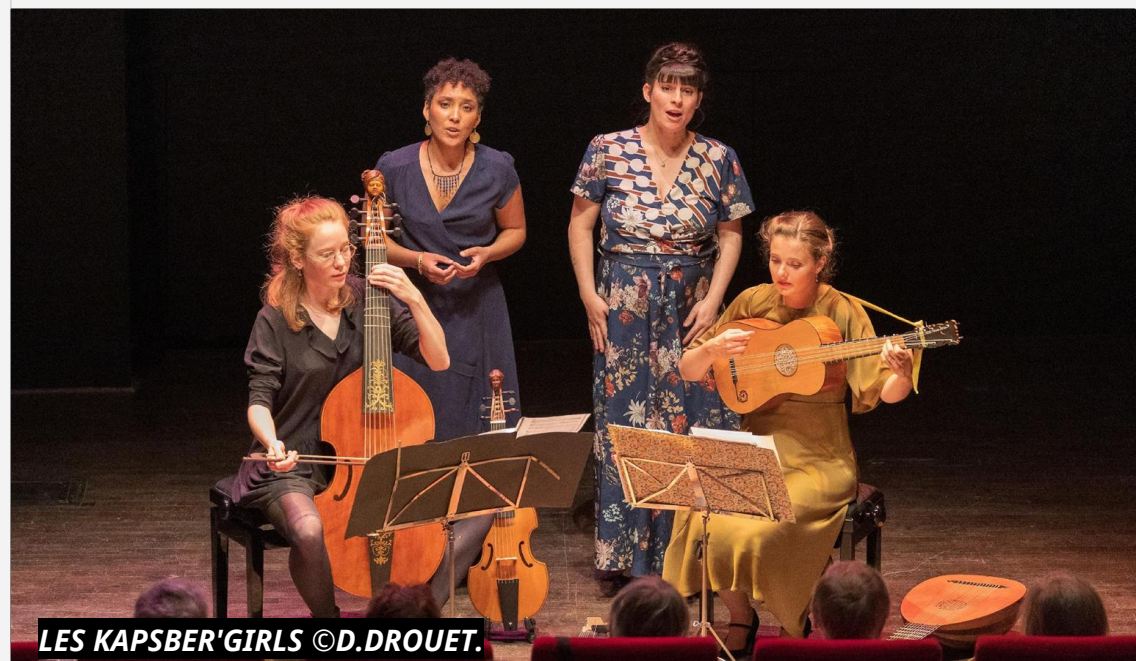
LES KAPSBER'GIRLS ©D.DROUET.