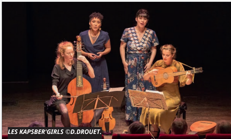
LES KAPSBER'GIRLS