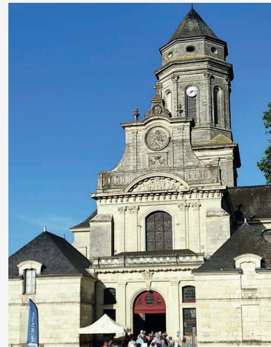
L'Abbatiale de Saint-Florent-le-Vieil

Cette petite cité de caractère se distingue comme l'un des hauts lieux touristiques de l'Anjou, valorisant son patrimoine et sa richesse culturelle à travers des lieux symboliques comme la maison Julien Gracq ou l'Abbatiale surplombant la Loire (photo à droite).