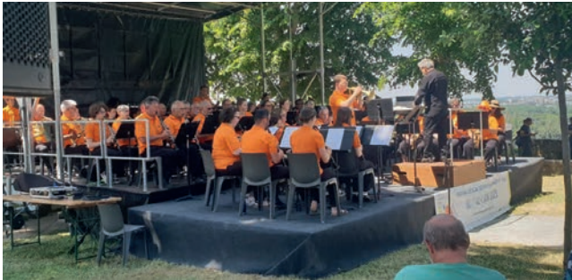
Le "village du festival" et le kiosque musical