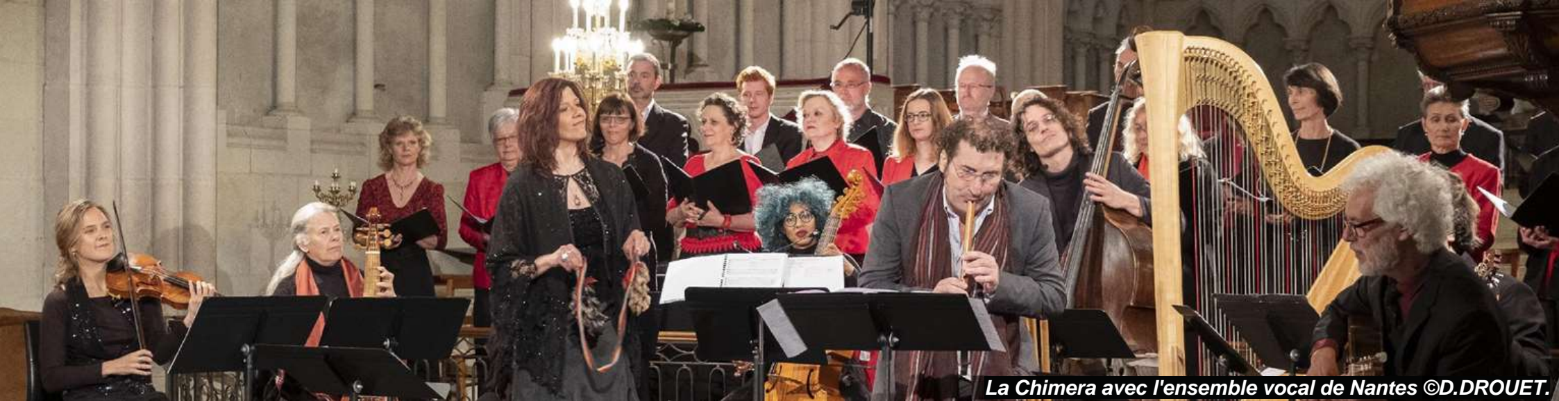
La Chimera avec l'ensemble vocal de Nantes