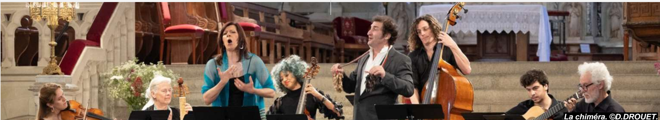
La chiméra.