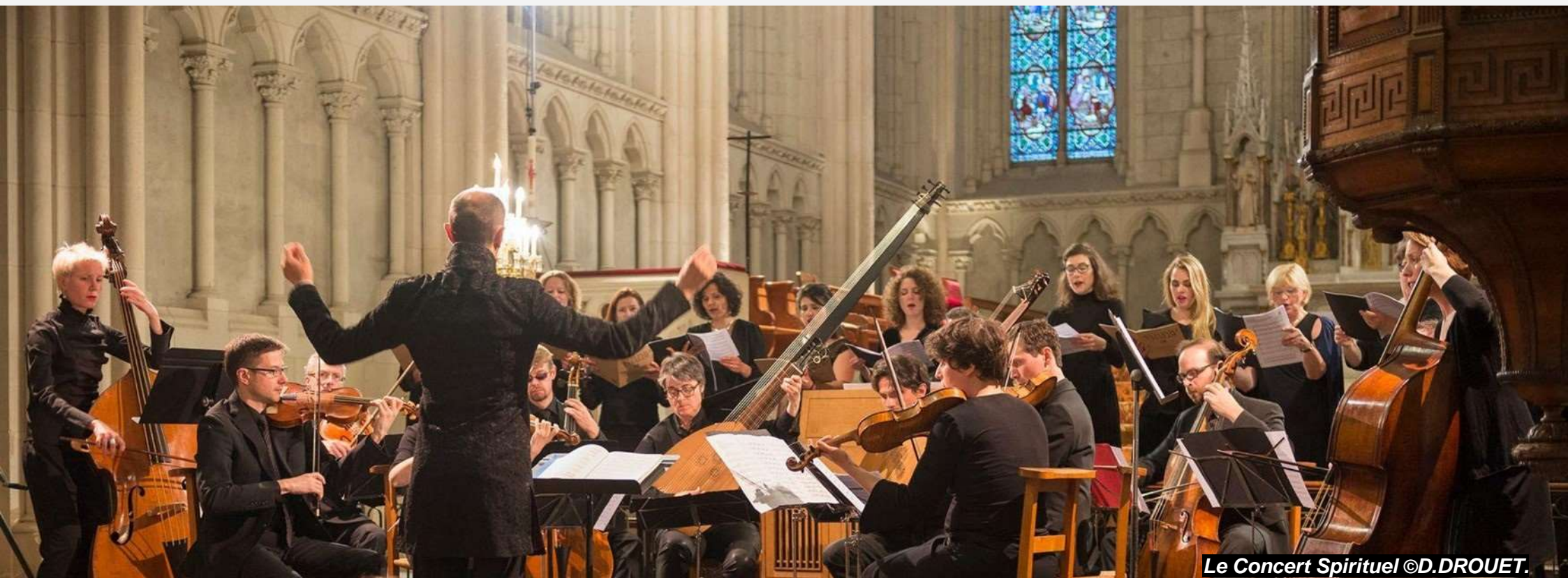
Le Concert Spirituel ©D.DROUET.