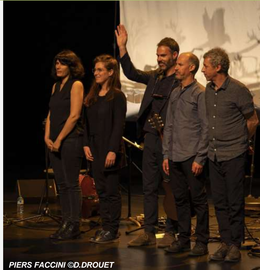
PIERS FACCINI