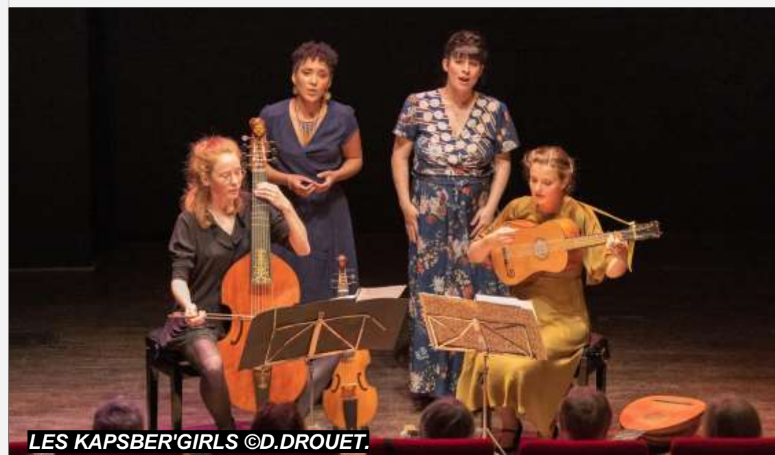
LES KAPSBER'GIRLS