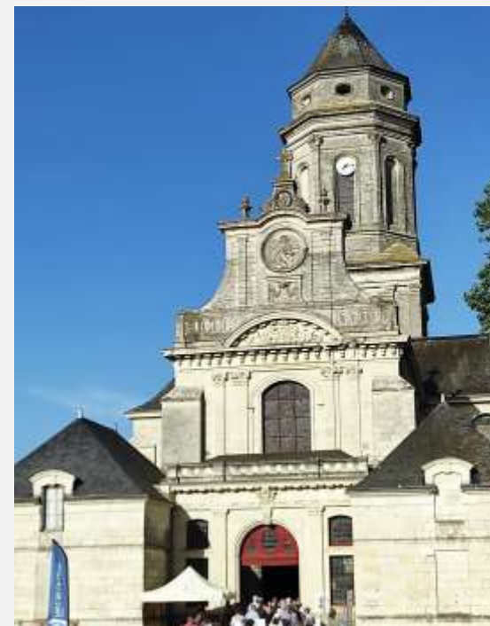
L'Abbatiale de Saint-Florent-le-Vieil

Cette petite cité de caractère se distingue comme l'un des hauts lieux touristiques de l'Anjou, valorisant son patrimoine et sa richesse culturelle à travers des lieux symboliques comme la maison Julien Gracq ou l'Abbatiale surplombant la Loire (photo à droite).