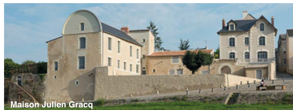
Maison Julien Gracq